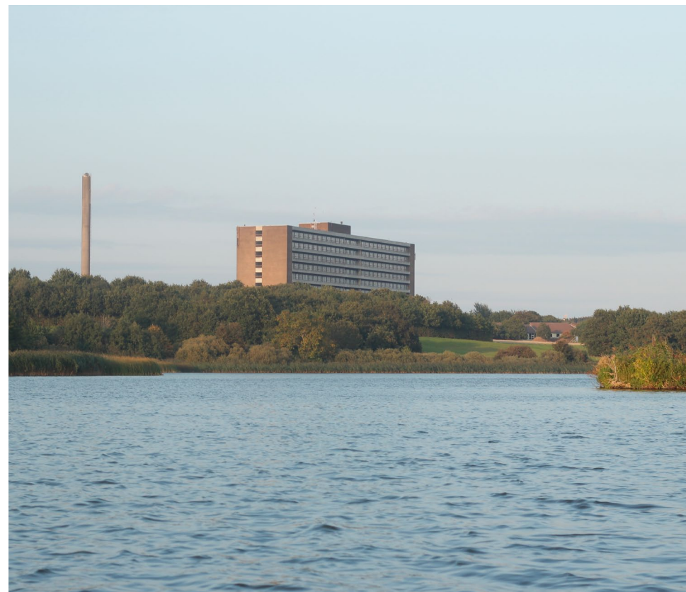
Haderslev Dam.

Resultater af undersøgelsen vil efterfølgende kunne ses på: miljoedata.miljoeportal.dk