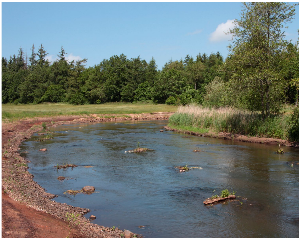
Stryg nedenfor Løgumkloster.

Den 2. juni var der arrangeret fremvisning af de nye stryg i Brede Å sammen med lodsejerne fra Gels Å Fiskeriforening, Torben Hansen fra Brede Å, Finn Sivebæk og SU. En rigtig givtig aften som sluttede i Brede Å's klubhus med kaffe og blødt brød.