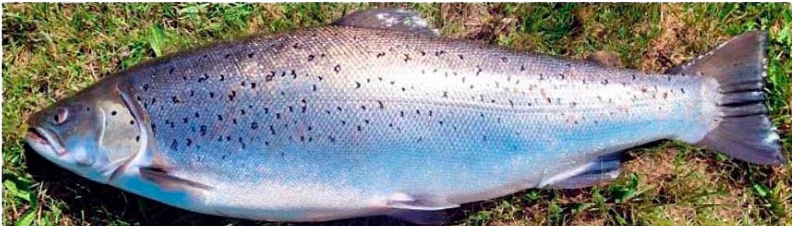
En flot havørred på 3,65 kilo og 68 cm fanget ved Bevtoft i Gels Å på en stor Humpy (Edderkop) bundet på krogstørrelse 6.

0,25 mm af fluocarbon – og så langt, som man kan styre!