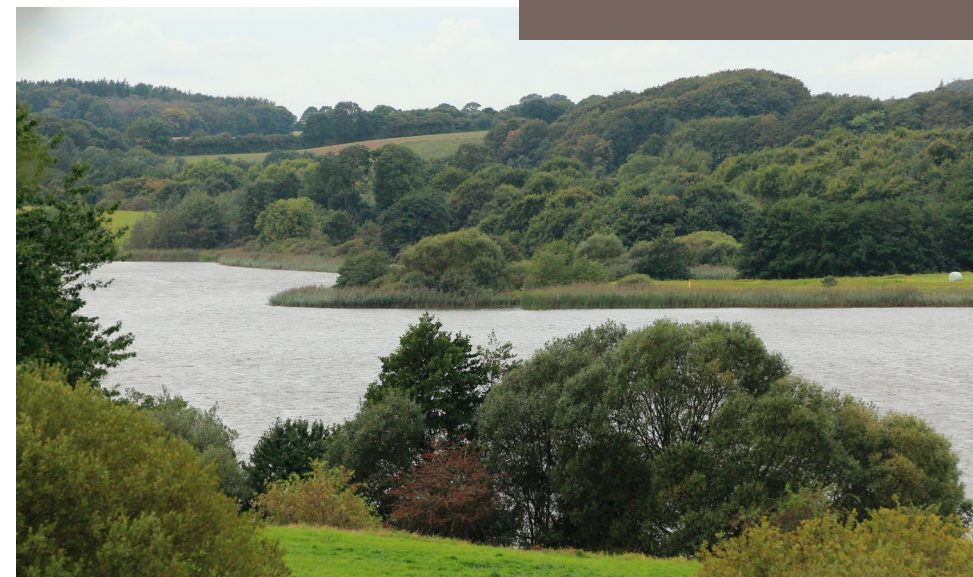
Der har med sikkerhed været en bestand af oddere i Haderslev Dam de sidste 5 år.

Man kan læse mere om regler for fritidsfiskere og lystfiskere på Fiskeristyrelsens hjemmeside.