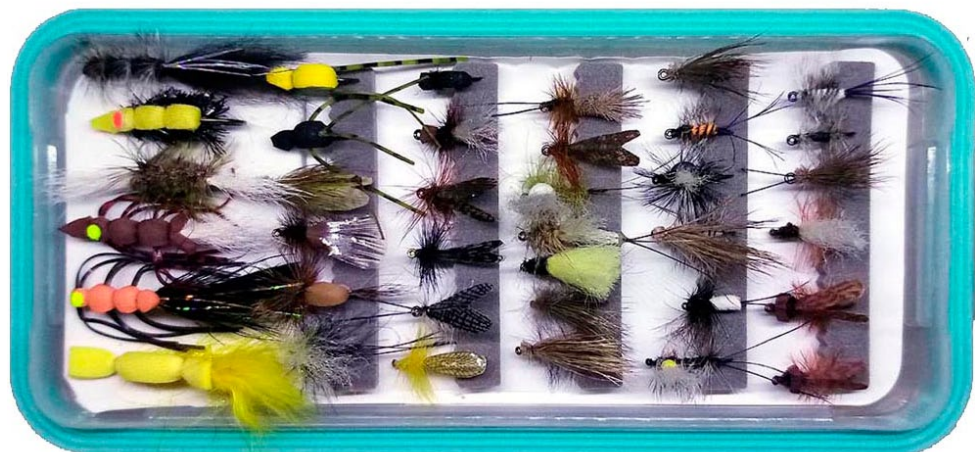
Her ses nogle af mine personlige bedste tørfluer til havørred.

Nu er vi i Danmark også kommet rigtig godt i gang med laksefiskeriet, og det er muligt at overføre tørfluefiskeriet til danske laks, men jeg har ikke selv erfaring med det praktiske fiskeri. Til gengæld har jeg i mere end 40 år bundet tørfluer til laks for mine nordiske kunder og har derfor fået et godt indblik i de mønstre, som bruges oppe i Skandinavien. Har man mod på at prøve kræfter med danske laks, så prøv at søge på nettet, hvor der efterhånden er samlet en del erfaring og vide herom.