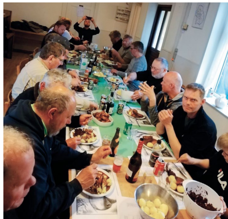
Aftensmad; medister med kartofler og rødkål.

Turen har mange traditioner og en af dem er indtagelse af grillpølser fredag middag på vestsiden af øen. Det er