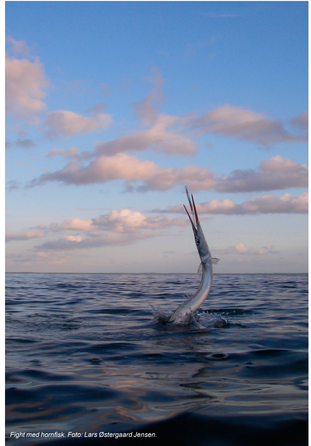
Fight med hornfisk.