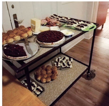
Aftenkaffe fredag. Ostelagkage og franskbrød med megen og længe lagret ost.