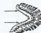
Fig. 1. Havørredens gælle.

Regnbueørreden kendes sikrest på, at den altid har hele halefinnen overskåret med små sorte pletter. Desuden er regnbueørredens skæl generelt lidt mindre end havørredens og laksens, og dens form er ofte lidt mere plump med et lille hoved.