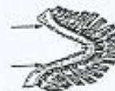
Fig. 2. Laksens gælle.