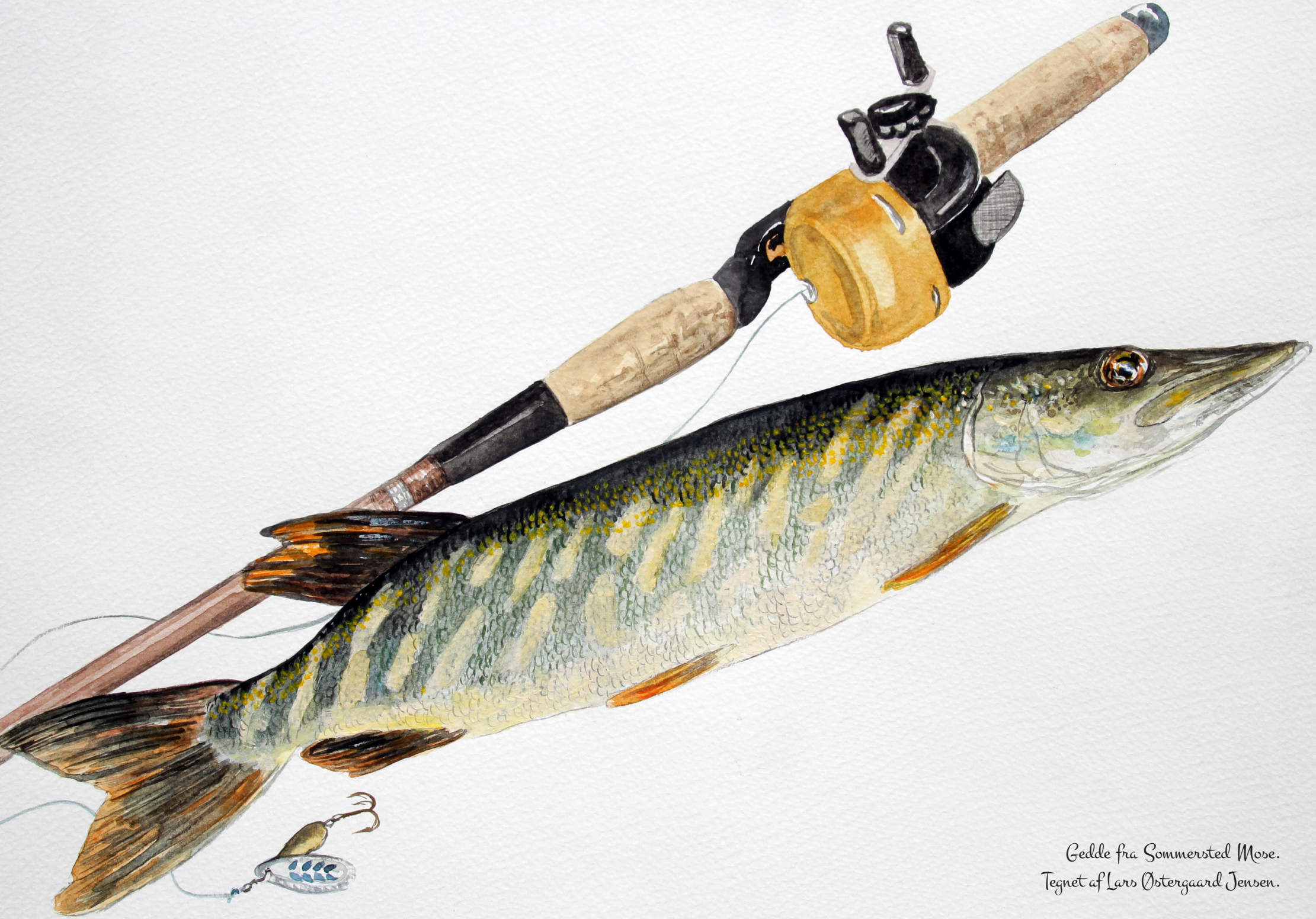
Gedde fra Sommersted Mose. Tegnet af Lars Østergaard Jensen.